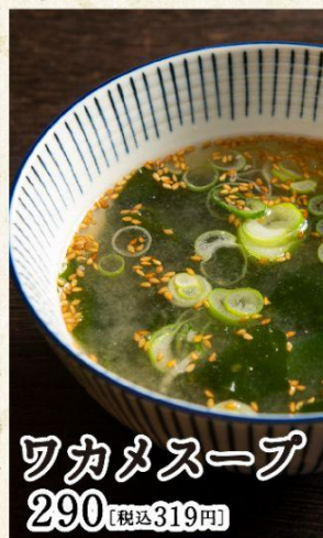
ワカメスープ 290 [税込319円]