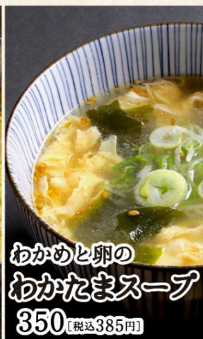
わかめと卵の わかたまスープ 350 [税込385円]