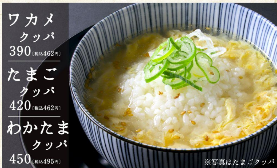
ワカメ クッパ 390 [税込462円]