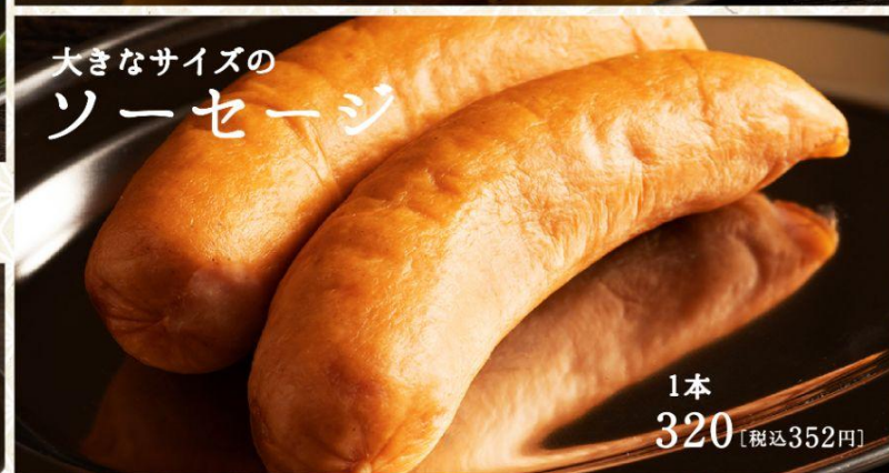
大きなサイズのソーセージ