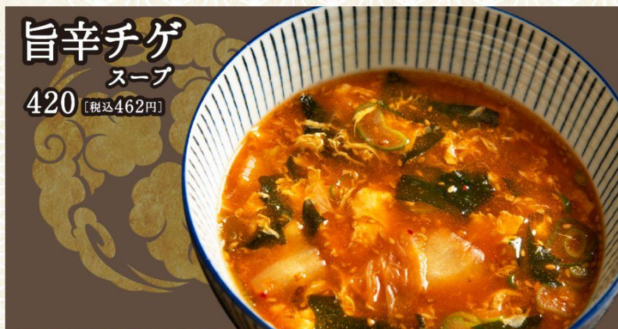
旨辛チゲ スープ 420 [税込462円]