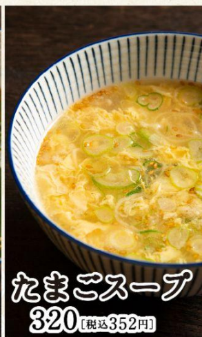
たまごスープ 320 [税込352円]