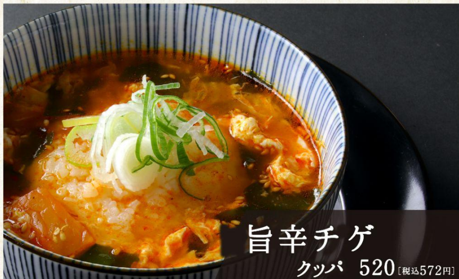
旨辛チゲ クッパ 520 [税込572円]