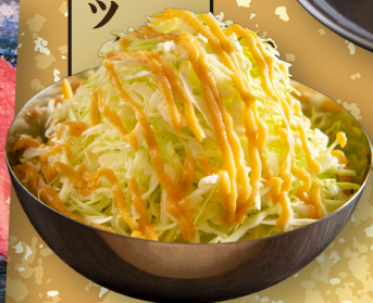
山盛り 千切り キャベツ