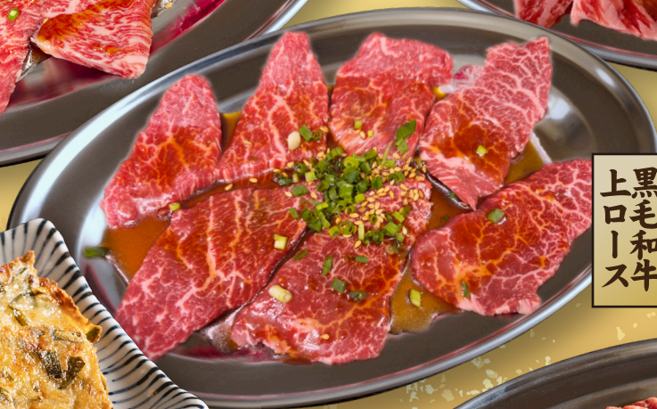
黒毛和牛 上ロース